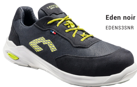
Eden noir S3S EDENS3SNR